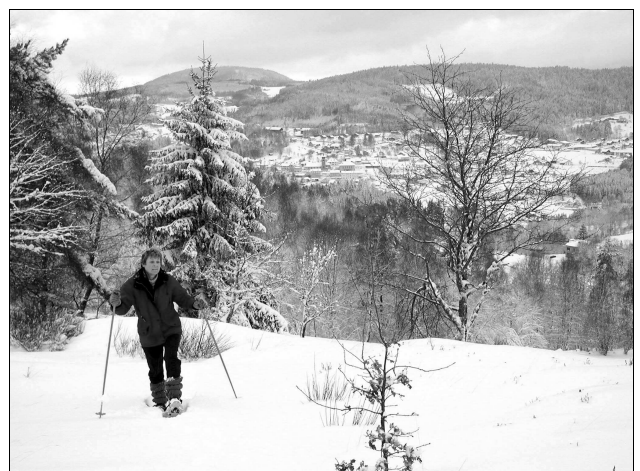
La Forge, Le Tholy et la vallée de Cleurie depuis Bouvacôte

Après avoir écrit l'histoire de Liézey, du Haut du Tôl, de la paroisse de Julienrupt et consacré plusieurs brochures et ouvrages à la vie des villages de la vallée de Cleurie, cet auteur a voulu mettre en lumière un village d'allure modeste, mais dont la richesse méritait d'être connue de ses habitants et de tous ceux qui sont attachés à ce coin de terre vosgienne.