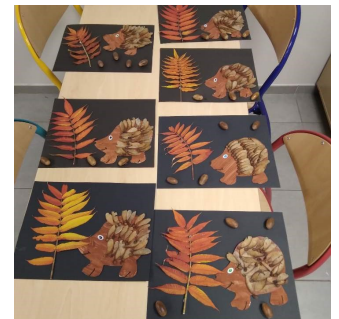
Travaux confectionnés par les enfants