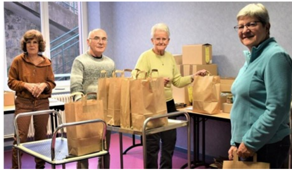
Le 3 décembre, les membres du CCAS se sont réunis pour préparer les colis offerts aux Cafrancs de+ de 73 ans.

Comme tous les ans, le CCAS a offert un colis aux personnes n'ayant pas pu venir au repas traditionnel des personnes de + de 73 ans. Cette année, 153 colis ont été préparés par les membres actifs du CCAS et distribués la première semaine de décembre. Le colis se composait de produits alimentaires, d'un magazine « causions-en » sur le village du Tholy et d'un jeu de cartes illustré par les photos de Joël Couchouron. A cela était ajouté un bon d'achat de 35 euros à dépenser dans les commerces locaux.